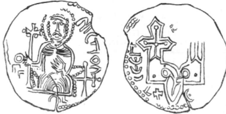
Срібна монета Святополка з родовим знаком Ярополка

Як відомо, вокняжінню Володимира Святославича в Києві передувала жорстока боротьба за владу між синами загиблого 972 р. у